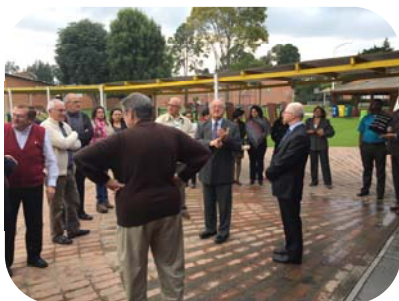
Visite du « Colegio San Viator » de Bogotá, Colombie