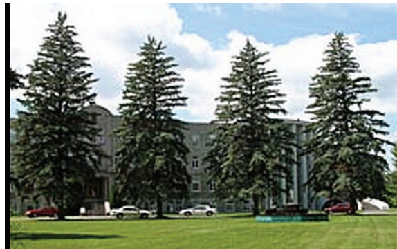
Le Centre de Réflexion chrétienne.

Il restait au troisième étage de la vieille aile, une communauté de Clercs Saint-Viateur. Il en restait quatorze cette année qui ont commencé à se disperser, certains au presbytère de Berthierville, d'autres au Centre Champagneur, à la résidence Saint-Viateur et au presbytère Christ-Roi.