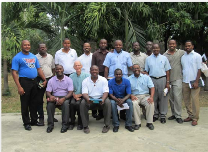
Accueil Saint-Viateur de Cazeau