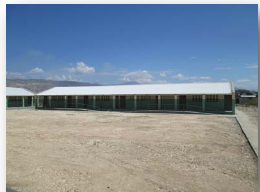
Vue d'un pavillon de la résidence.

Pour le comité, P. Lindbergh MONDÉSIR, c.s.v.