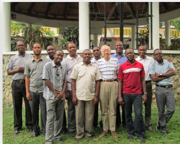
Devant l'hôpital Cardinal-Léger à Léogâne.