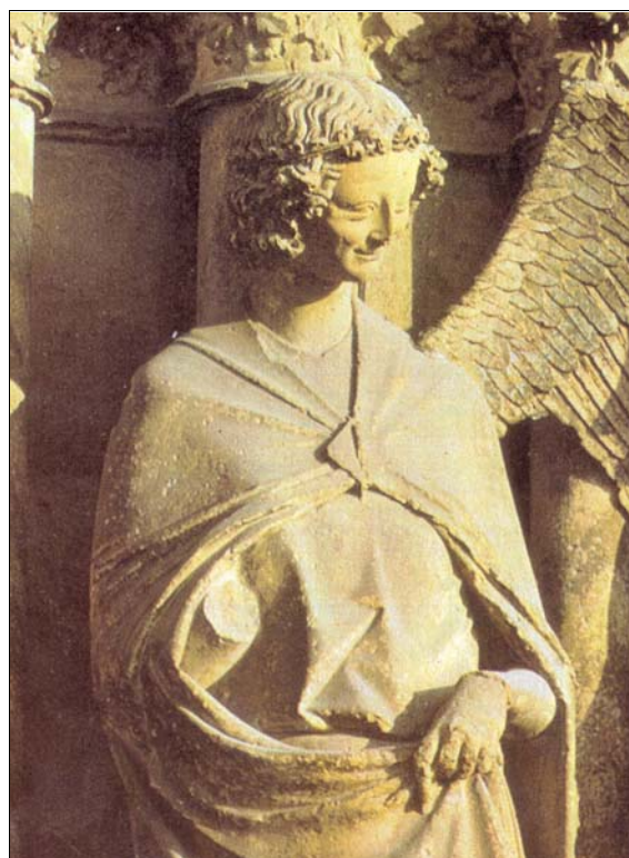
L'ANGE GABRIEL du groupe de l'Annonciation (ébrasement droit du portail central) Reims.