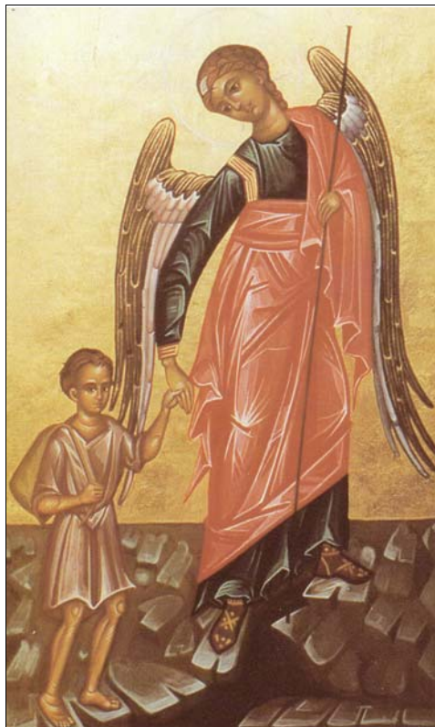
ANGE GARDIEN Icône en provenance des Petites Soeurs de Jésus

En bref, le courrier reçu témoigne sans cesse des merveilles opérées par cette oeuvre modeste et magnifique qui, me semble-t-il, doit non seulement survivre mais se développer pour que « adoré et aimé soit Jésus ». Puissent ces quelques lignes donner envie de découvrir le petit bulletin L'Ange Gardien d'aujourd'hui et encourager la croissance de cette cellule ecclésiale au goût d'Évangile, ce fruit viatorien et querbésien où catéchèse, liturgie et piété populaire se conjuguent harmonieusement en vue de l'éducation de la foi. ■