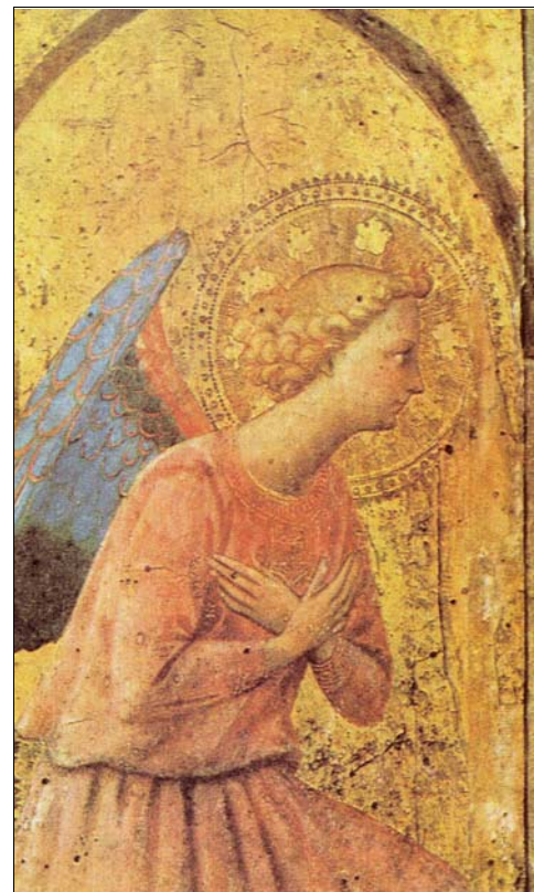
UN ANGE Fra Angelico Musée du Louvre, Paris.

Mais L'Ange Gardien n'est pas qu'une brochure bimensuelle. C'est aussi une grande communauté médiatique fervente et unie : des membres actifs, de nouveaux abonnés ou lecteurs qui s'expliquent, nombre d'adhérents de toutes conditions d'une fidélité et d'une solidarité émouvantes, de belles familles, des gens qui croient à la force de la prière dans la communion des saints