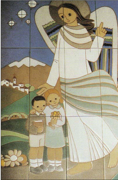
ANGE GARDIEN (céramique) soeurs bénédictines de Montserrat, Espagne.

et qui disent pourquoi ils aiment L'Ange Gardien et en soutiennent les réalisations concrètes. Au-delà des frontières françaises, nous servons quelques centaines d'abonnements. Des images, des feuillets de prière, de petits calendriers de poche et des médailles sont fournis à ceux qui en font la demande et qui, à leur tour, les distribuent comme des semences de joie. Le site internet a été sélectionné par Croire.com , coédité par le magazine français Panorama , pour la qualité de ses contenus et une version papier en a été tirée à 12 000 exemplaires.