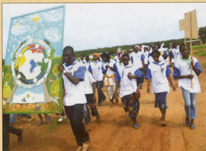
La marche des campeurs dans les rues de la ville de Banfora.