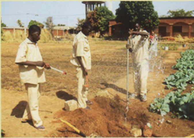
Classe de plomberie : découvertes et surprises liées à l'installation du système d'irrigation d'un jardin.