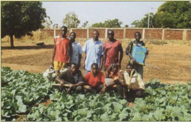
Groupe de jeunes de la classe « agriculture-élevage ».