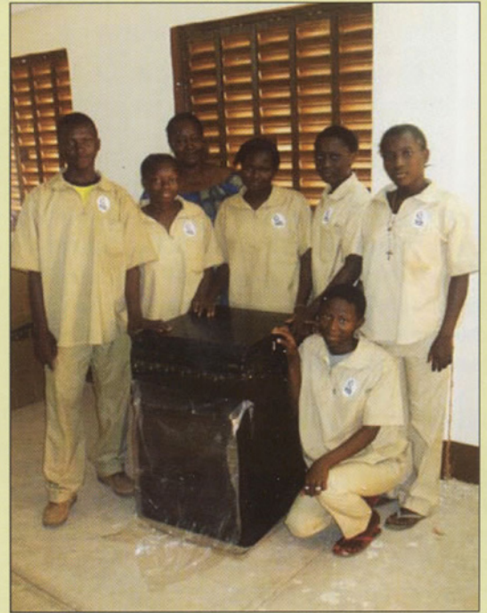
Élèves de la classe « restauration-cuisine » en compagnie de leur professeur.