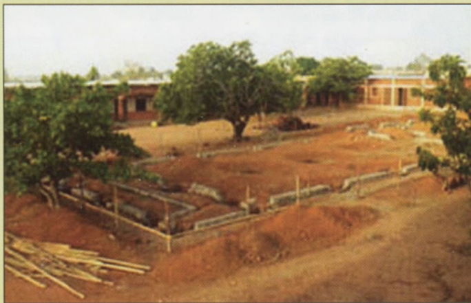
Nouvelle construction avec l'appui financier de l'ONG espagnole SERSO. Le pavillon aura 2 étages : les laboratoires au rez-de-chaussée et 3 classes au 2e étage.