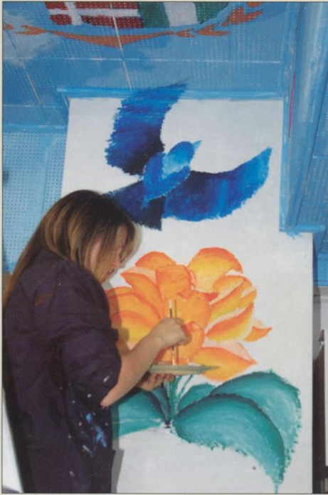
Une colombe pour la paix. Picasso a la sienne, Bourget aussi!

De plus, nous souhaitons développer les échanges avec d'autres établissements. Nous avons reçu, au cours des dernières semaines, un petit groupe d'élèves du collège des Viateurs du Japon (Rakusei), accompagnés de leur directeur, et un autre d'un lycée de la région d'Atlanta. L'enseignement du français est offert dans cette école américaine. Des liens se tissent et devraient porter fruit.