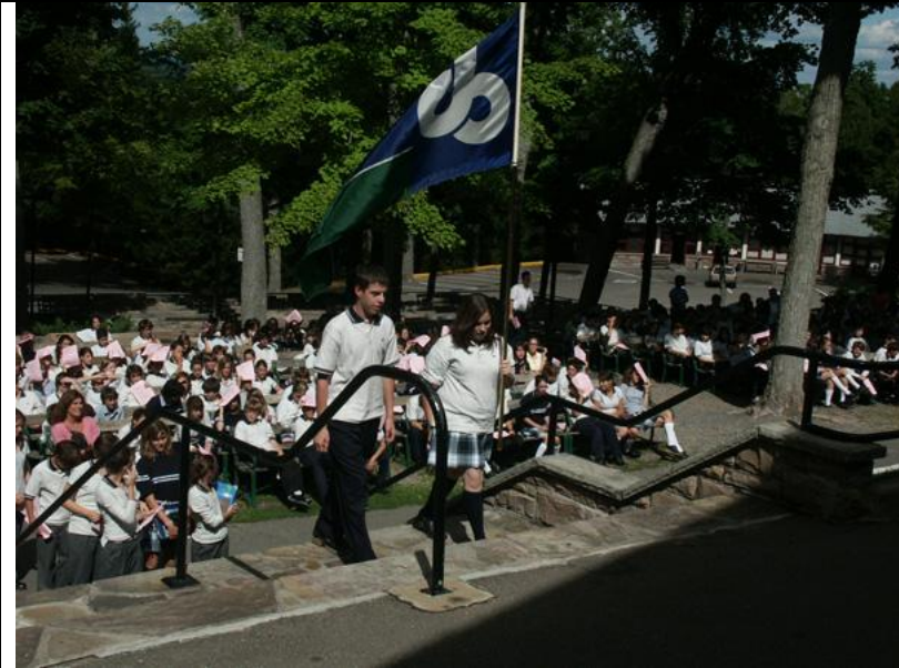
Une montée au sanctuaire de Lourdes. À l'avant : une fille, un gars et les couleurs du Collège Bourget!