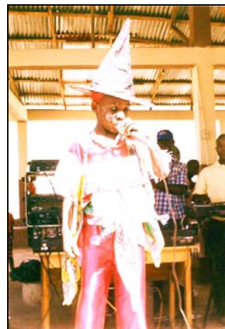
Carnaval scolaire : chants, « contines » et concours de déguisement...