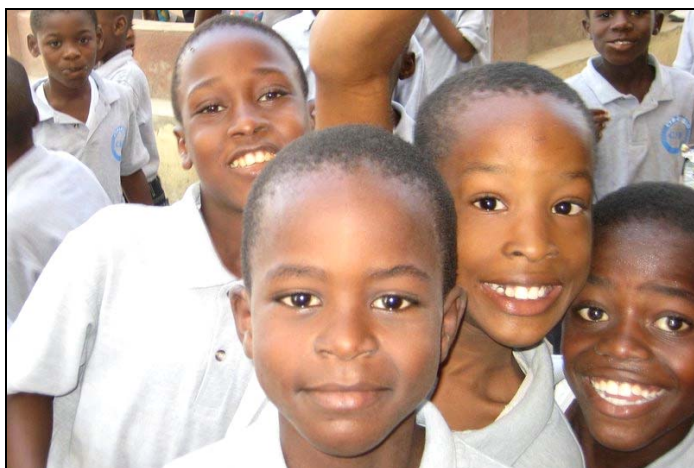
Bonne humeur et dynamisme des élèves!