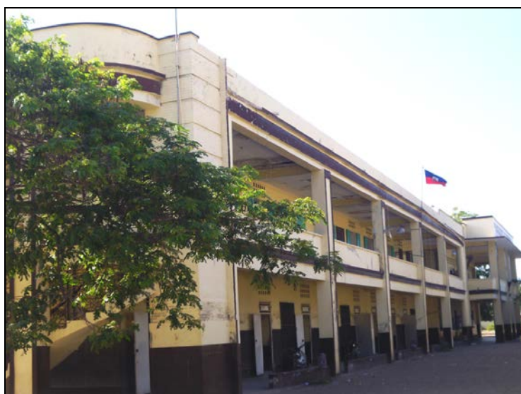
ÉCOLE NATIONALE CONGRÉGANISTE PUBLIQUE CYR GUILLO