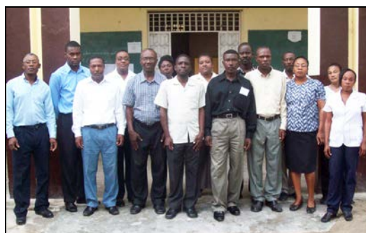
Le corps professoral de l'école en 2012.