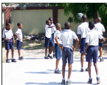
Partie de basket à Cyr Guillo.