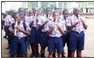
Élèves jouant de la flûte au moment de la levée du drapeau.