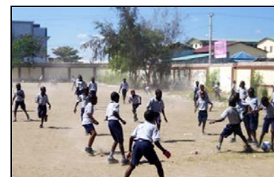
Partie de foot... ou de soccer, dans la cour de l'école.