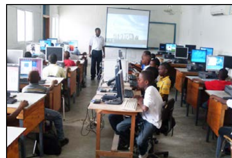
→ ... les élèves de 6 e année fondamentale, ceux qui entreront au C I C, en septembre prochain.