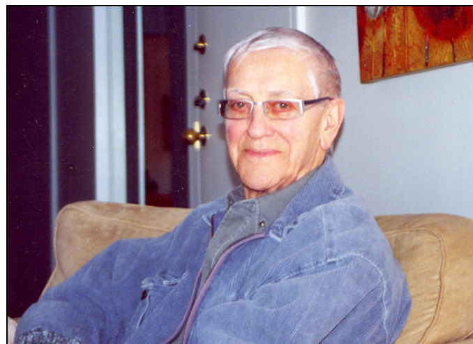
Tantôt il paraît plus assuré, plus convivial, comme sur la photo, et même plus allumé, plus théâtral dans son expression verbale et sa gestualité !

Au fil des années, le septuagénaire puis l'octogénaire se passionne pour les grandes questions existentielles que sont l'humanisme, le bonheur, le temps, l'angoisse, la souffrance... Ses lectures alternent entre Confucius, Pascal et Heidegger, entre saint Augustin et le Livre de la Sagesse dans la bible. L'artiste en lui l'a toujours sensibilisé au sens de l'absolu, et la lumière qu'il y trouve dorénavant, l'incite à un regard contemplatif. ■