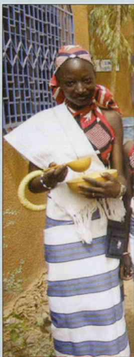
Rite d'accueil au Burkina Faso. (Endos du livre)

Bonjour à vous tous du « Club des 100 », ainsi qu'à nos confrères Viateurs, nos parents, amis-es et bienfaiteurs.