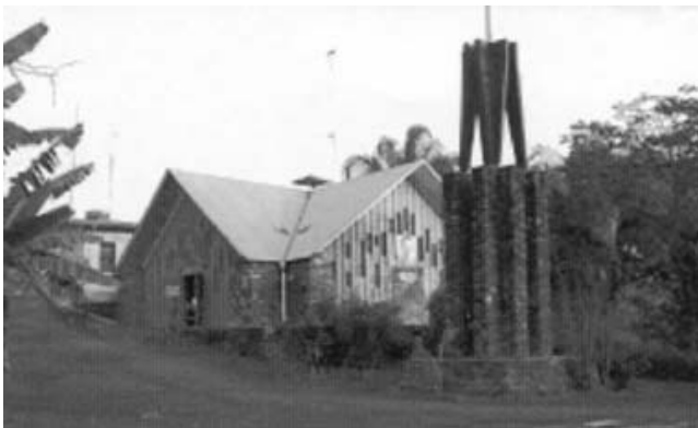
La paroisse Espiritu de Popoy, en Bolivie