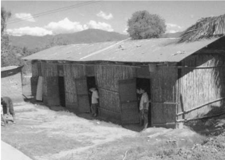
Voici des dortoirs réservés aux garçons de l'Internat Juan Pablo II . On les remplace graduellement par des pavillons recouverts de briques comme c'est le cas pour ceux des filles.

Le 8 décembre, fête de l'Immaculée-Conception, nous célébrons la fête patronale de la paroisse. Chaque année, un groupe choisi de personnes passe trois jours à fêter, à danser et faire de l'animation dans la population. Le jour de la fête, tout ce monde entre dans l'église en dansant et en chantant devant l'image de l'Immaculée-Conception.