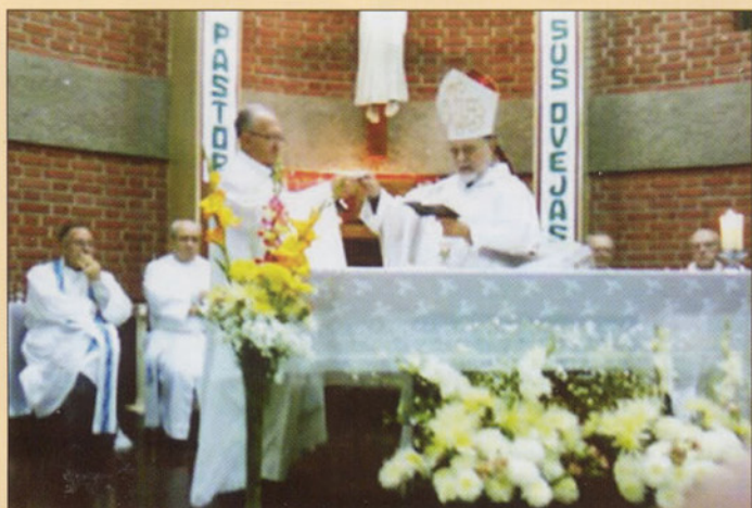
Remise des clés de la paroisse au nouveau pasteur par M gr Lino Panizza, l'évêque du diocèse.