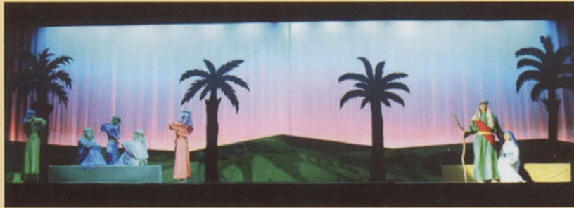
Tableau 4 Joseph et Marie en route vers Bethléem.