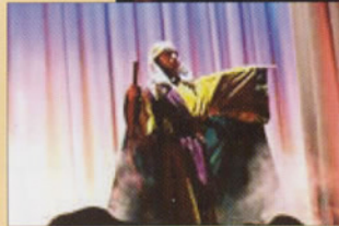
Tableau 1 La prophétie qui annonce la venue du Messie. À gauche Le prophète Isaïe. (détail)