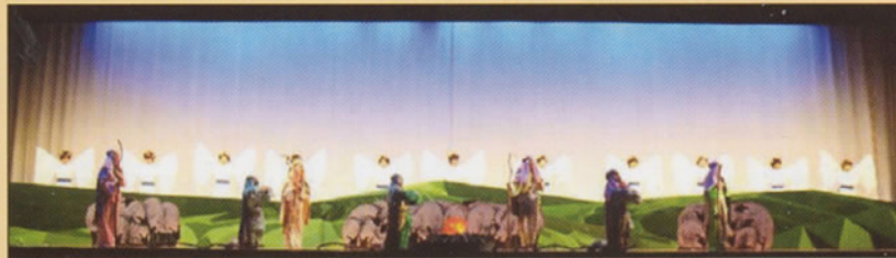
Tableau 5 Le chœur des anges annonçant la Bonne Nouvelle aux bergers.