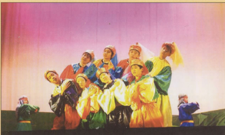
Tableau 8 a

Un Sauveur nous est né ! Dansons, chantons !