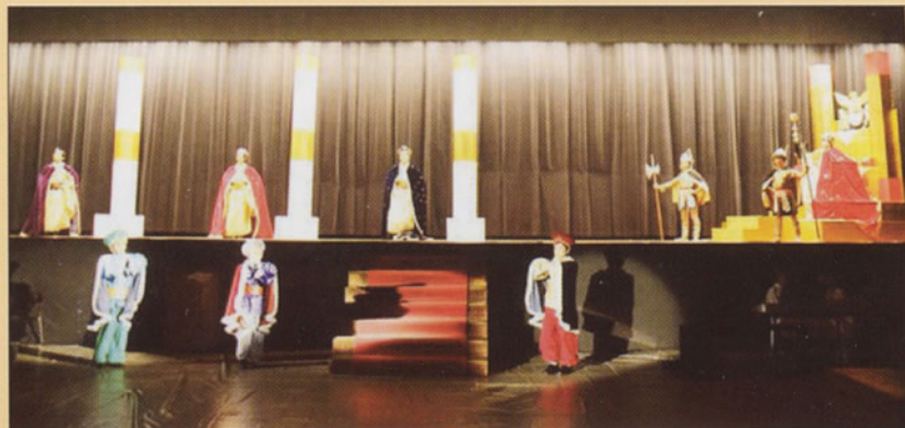
Tableau 6 Visite des mages au roi Hérode.

Dès l'ouverture, pour favoriser l'atmosphère spirituelle de la fête, le P. Labadie, président de l'école Rakusei, vêtu de l'aube blanche, récite une prière avec les benjamins de l'école. Ce moment de prière constituait aussi un temps de recueillement pour toute l'assistance.