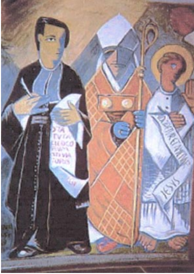
Image symbolique de la fondation canadienne.

Un consensus autour d'une refondation, d'une revitalisation de leur grande famille religieuse, un consensus qui ne peut s'opérer sans une prise de parole, dans laquelle ils se reconnaissent et repèrent les jalons qui doivent baliser la voie de leur avenir.