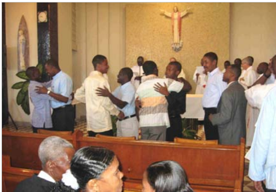
Échange de la paix, au cours de la célébration de la profession religieuse.