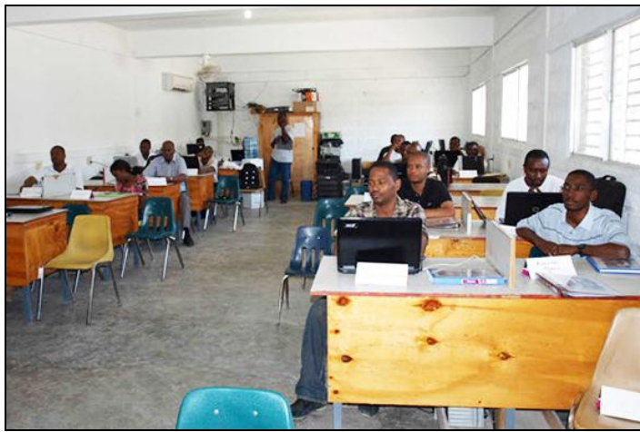
Autre session de recherche dans la salle des ordinateurs du collège.