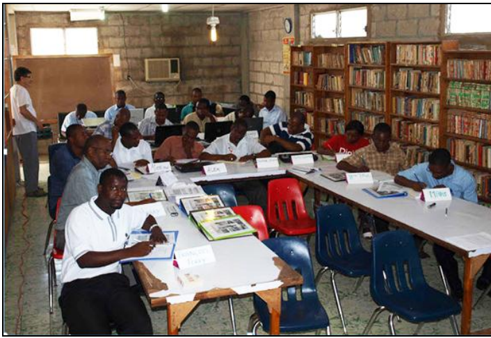
Les 23 religieux et associés-es inscrits au Séminaire sur la gestion des projets, en travail de recherche dans la bibliothèque du CIC.