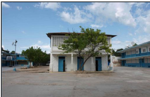
Le collège Immaculée-Conception des Gonaïves.