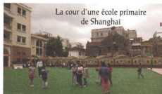
La cour d'une école primaire de Shanghai