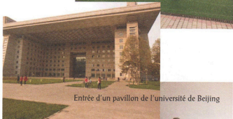
Entrée d'un pavillon de l'université de Beijing