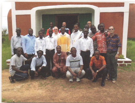
Clôture de l'Assemblée de la Fondation et ouverture du noviciat

Du 14 août au 10 septembre dernier, j'ai eu la joie de rencontrer les Viateurs de la fondation du Burkina Faso. Une visite de présence, d'écoute, d'appui, une visite très cordiale et intense, un moment d'observation et d'encouragement pour le dynamisme et le dévouement des confrères dans le développement du charisme viatorien en terre burkinabè. Cela m'a permis de prendre le pouls de la fondation et d'attirer l'attention sur des orientations nécessaires. Car la fondation n'est plus à ses débuts, elle est en situation de consolidation, d'appropriation des valeurs religieuses et de ses membres. Elle se projette vers son avenir qui se construit progressivement grâce à l'enthousiasme et à la détermination de tous.