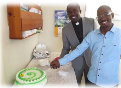
C'est l'heure de couper le gâteau.