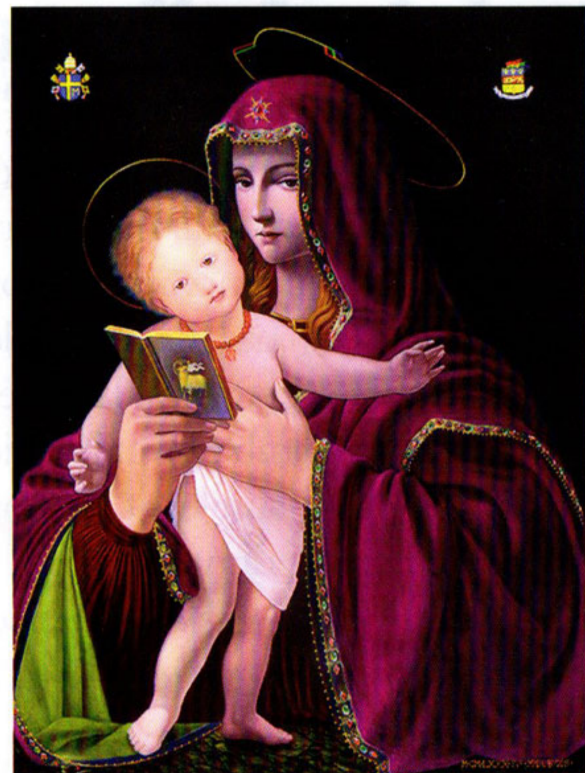
Mater Salvatoris 1984

une Vierge à l'enfant (Mater salvatoris). Offerte au pape, cette œuvre se trouve aujourd'hui au Musée du Vatican.