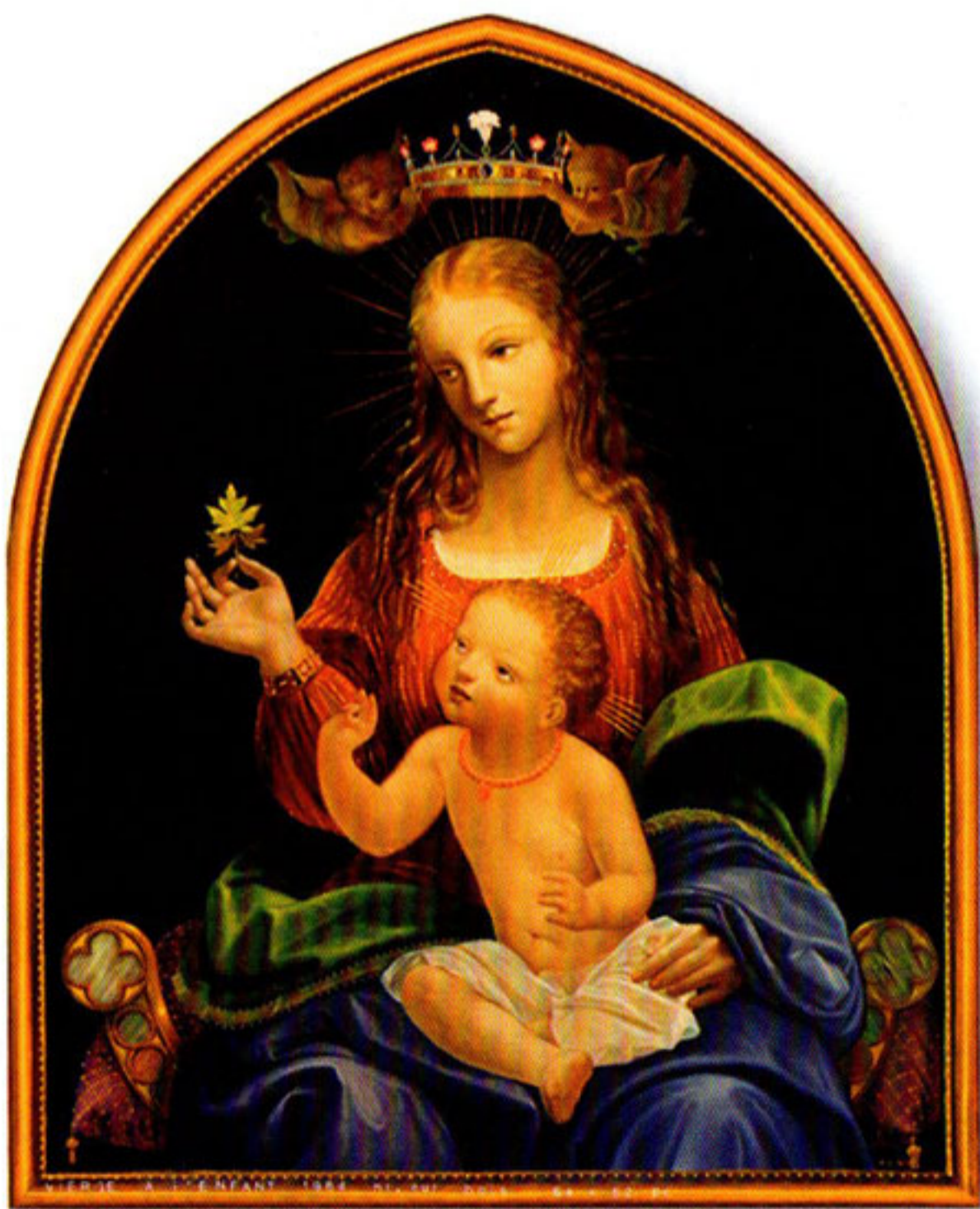
Notre-Dame du Canada 1983

Lors de la visite du pape Jean-Paul II au Canada en 1984, le gouvernement du Québec lui commanda