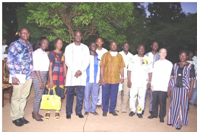
Les dix pré-associés tout souriant.

Voici un extrait du mot du F. Victor Zongo, supérieur de la Fondation