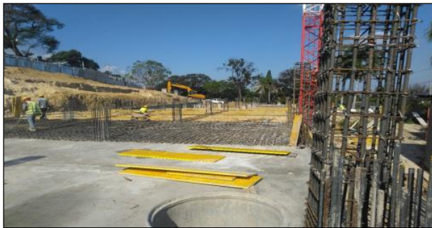
Le bétonnage de la centrale du Niveau 1