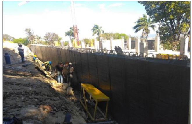
Imperméabilité du mur de soutènement