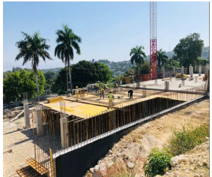
Vue complète du chantier