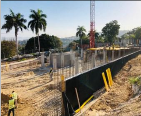
Terrassement et assainissement extérieur