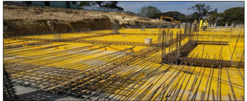
Le coffrage et le ferrailage de la dalle du Niveau 1