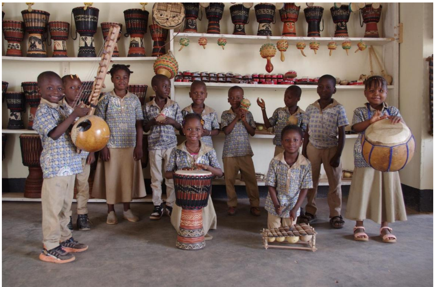
Le secteur de la musique traditionnelle a été la plus populaire