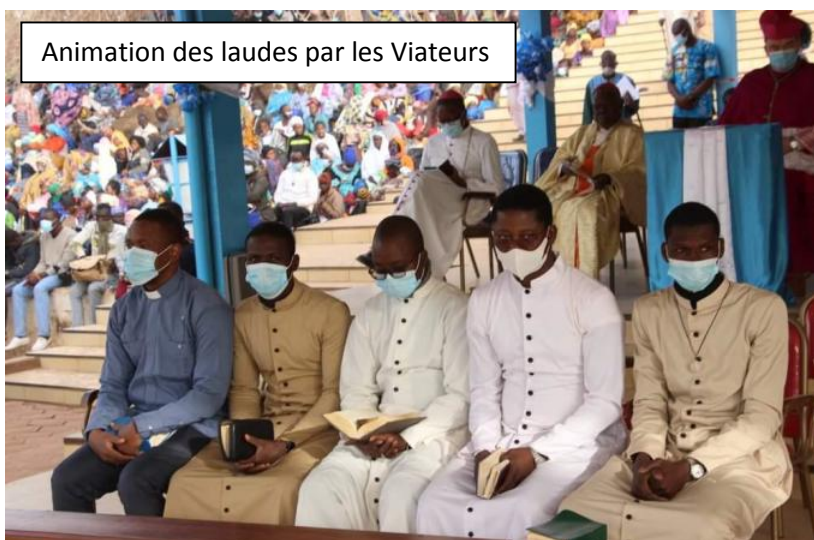
Animation des laudes par les Viateurs