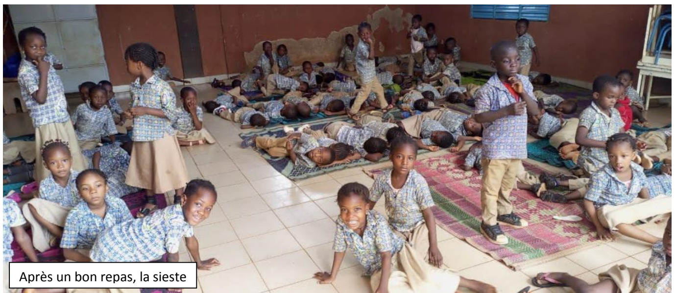
Après un bon repas, la sieste