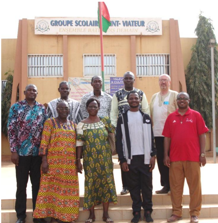
Notre instituteur certifié