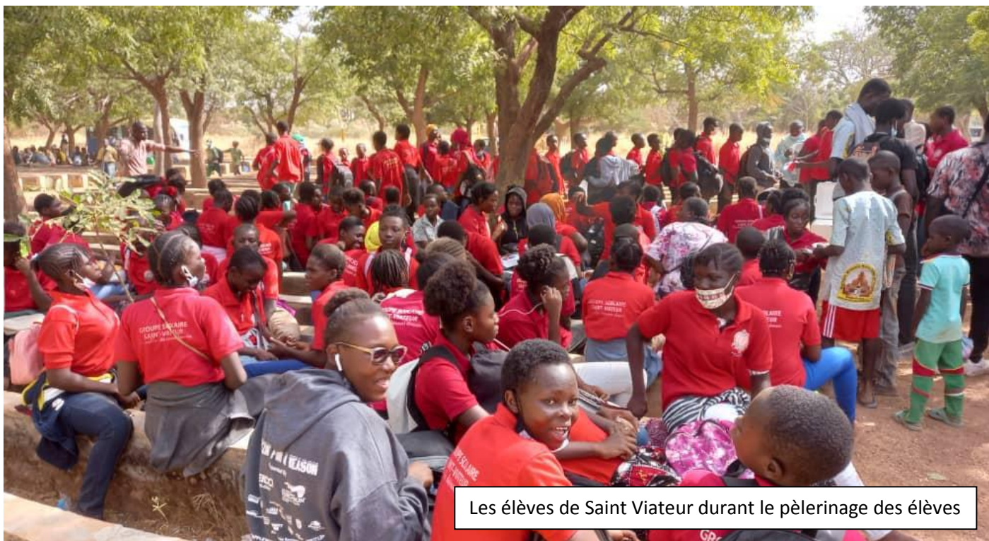
Les élèves de Saint Viateur durant le pèlerinage des élèves