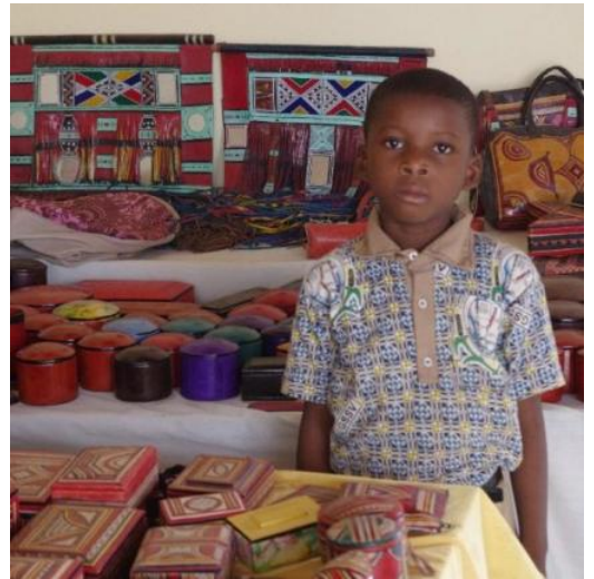
Trois sections : les sculptures sur bois, les figurines en bronze et la transformation du cuir.