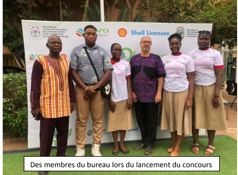
Des membres du bureau lors du lancement du concours

Le Bureau du Club écologique à Vivo Energy, structure de Shell, qui organise une composition entre dix établissements scolaires dans la ville de Ouagadougou.