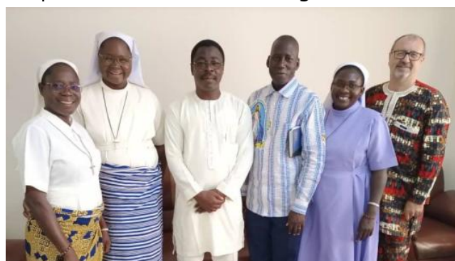
Les membres du bureau de l'UNESC avec le Directeur Provincial de l'Enseignement post primaire et secondaire de Kadiogo (au centre, en blanc)

À partir des années 1990, l'Église a révisé sa position vis-à-vis de la pastorale scolaire et s'est réorganisée dans la perspective d'un nouveau départ. Dans le souci d'impliquer toutes les structures de base de l'Église, une réflexion a été organisée sur le plan national. Pour ce faire, une commission nationale de réflexion a été mise en place. La concertation organisée en 1995 a permis de recueillir les attentes des populations sur la question de l'éducation au Burkina Faso. Dans le souci d'impliquer au maximum les acteurs du système éducatif dans la conception des nouvelles orientations de l'enseignement catholique national, l'épiscopat burkinabè a décidé la convocation des assises nationales de l'enseignement catholique. Ces assises, organisées du 16 au 20 décembre 1996, ont permis de réunir des délégués des différents diocèses du Burkina, des représentants des structures intervenant dans la gestion du système éducatif, des partenaires techniques et financiers et des représentants de l'enseignement catholique d'Afrique et de France. Pendant cinq jours, les participants se sont penchés sur la relecture des statuts de l'enseignement catholique et sur la conception d'un projet éducatif national de l'enseignement catholique. Les travaux des assises nationales ont donné lieu à l'élaboration d'un document de synthèse ( Actes des assises ) adopté par la Conférence épiscopale des évêques du Burkina le 10 mars 1997.