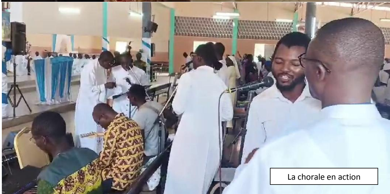
La chorale en action