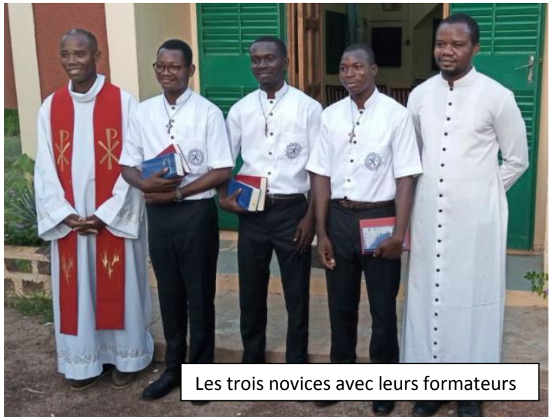
Les trois novices avec leurs formateurs