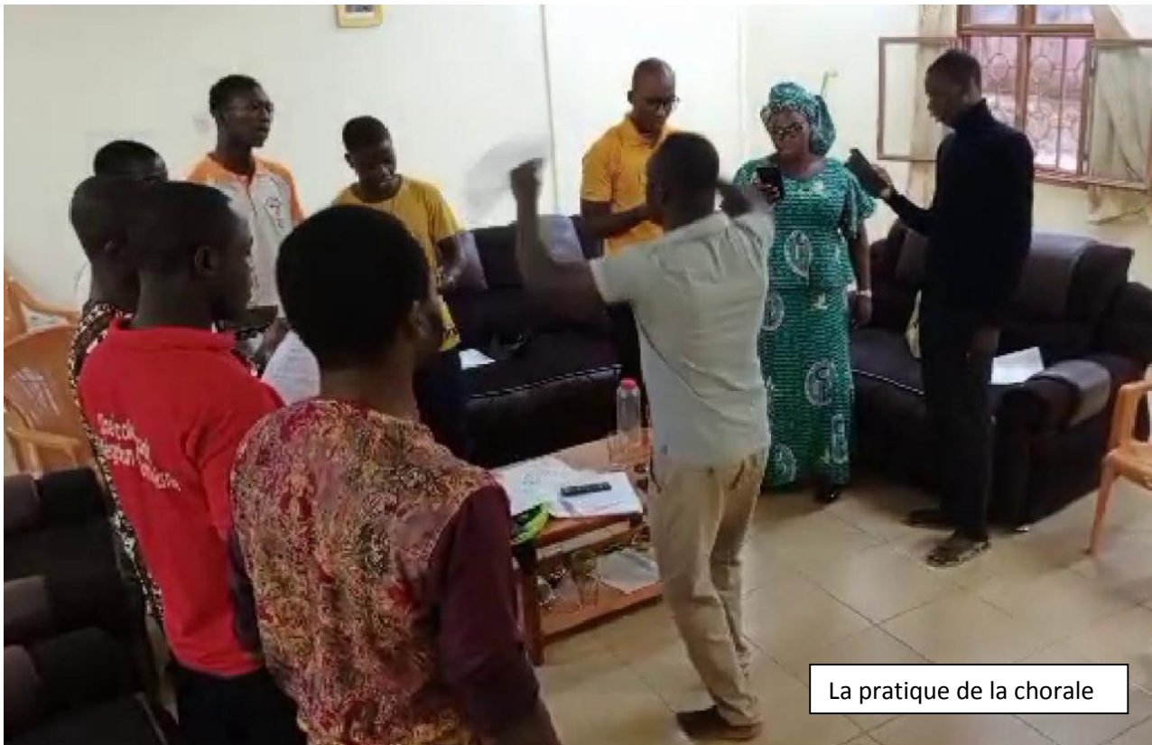
La pratique de la chorale