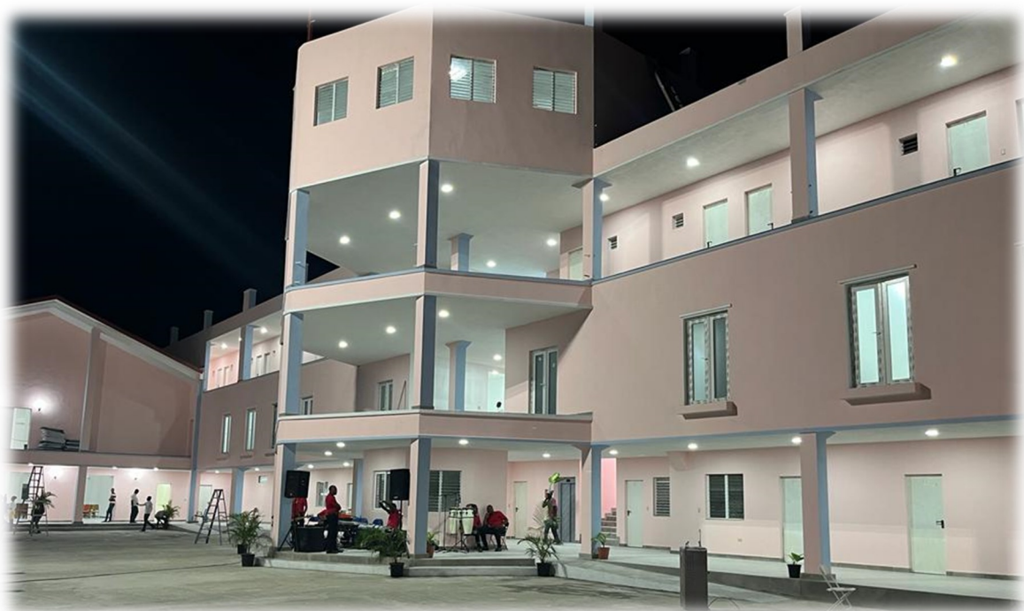
La Villa Saint-Viateur le soir.

Note : un album-souvenir est en préparation qui relatera l'événement de ce 10 décembre 2023: l'inauguration de la Villa Saint-Viateur.