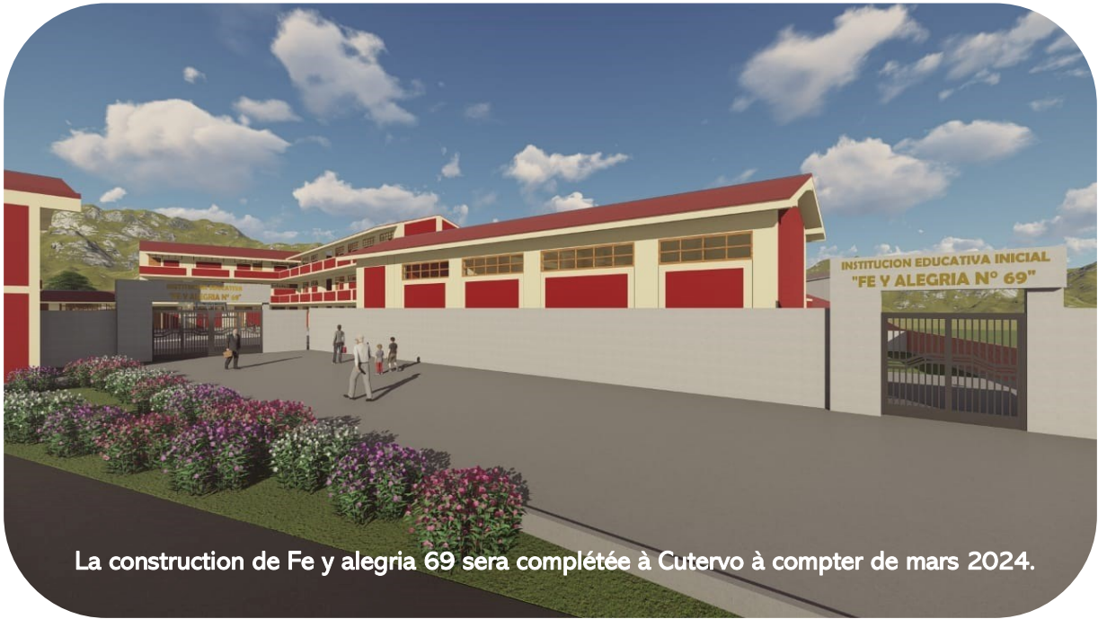
La construction de Fe y alegria 69 sera complétée à Cutervo à compter de mars 2024.