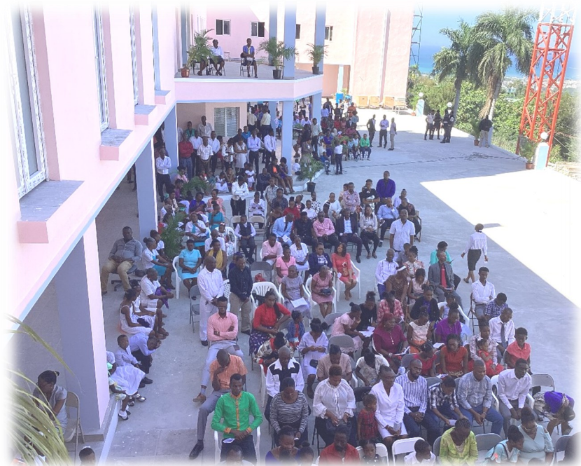
L'assistance extérieure à l'inauguration de la Villa Saint-Viateur.