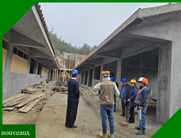
La construction en cours des nouveaux locaux de l'école de Cutervo