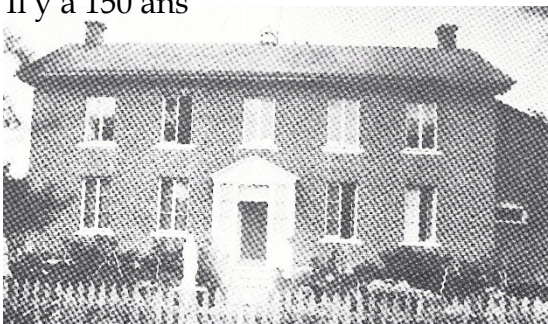
La première école dirigée par les clercs de Saint-

En 1874, c'est l'arrivée des premiers clercs de Saint-Viateur à Lanoraie sur l'invitation du curé l'abbé Clément Loranger. Les clercs de Saint-Viateur vont fonder une école pour l'enseignement des garçons et à la même époque les sœurs de la Providence vont s'occuper de l'enseignement des filles.