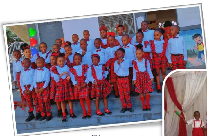
Figure 8. Les enfants de l'IMSV