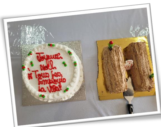
Figure 11. Gâteaux

🌟 Bravo à tous et encore une fois, joyeuses fêtes ! 🌟 🎄