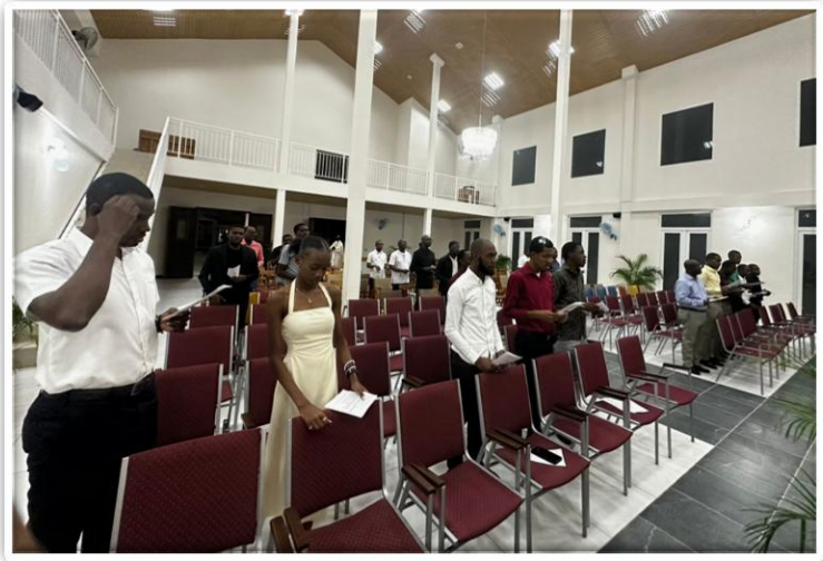
Figure 1. A l'intérieur de la chapelle de la Villa Saint-Viateur

Célébrer la magie de Noël en Communauté est un véritable cadeau, une expérience qui renouvelle notre foi et notre fraternité. Généralement, les membres de la région d'Haïti se rassemblent pour partager la joie de Noël. Malheureusement, la situation alarmante que traverse le pays en ces temps-ci a empêché plusieurs confrères de participer à ce moment de convivialité. Malgré cela, une