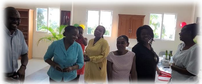
Figure 10. Photo du personnel de cuisine.

🌟 Bravo à tous et encore une fois, joyeuses fêtes ! 🌟 🎄