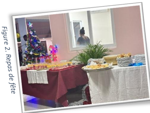
Figure 2. Repas de fête