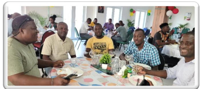
Figure 12. Travailleurs du Firme de construction