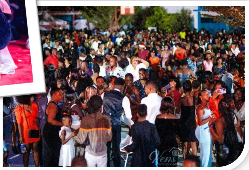
Figure 6. Le public exceptionnel de la Chorale Alegria.