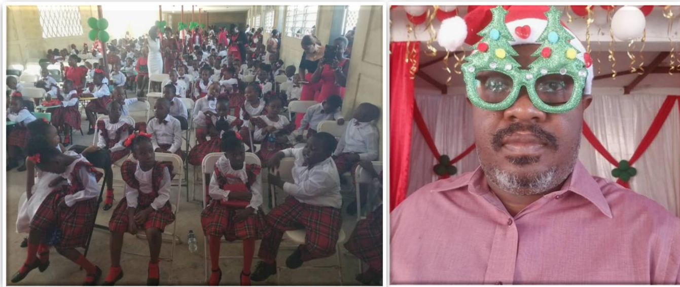
Figure 7. Les enfants de l'Institution Mixte Saint-Viateur (IMSV) à l'auditorium Louis Querbes.

Noël à Saint-Viateur Kindergarten et Institution Mixte Saint-Viateur : Une tradition de joie et de partage. Malgré les défis économiques, les enfants des deux écoles ont célébré Noël avec joie, partage et créativité. Entre chants, danses et cadeaux, la magie de cette fête a illuminé petits et grands.