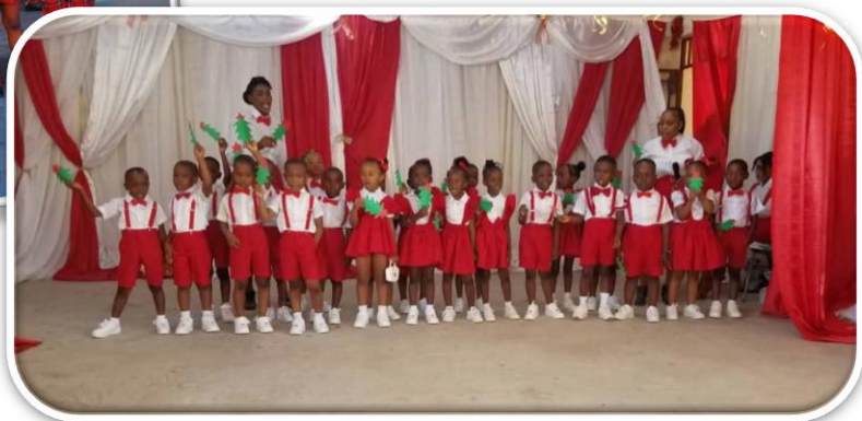
Figure 9. Les enfants du kinder.