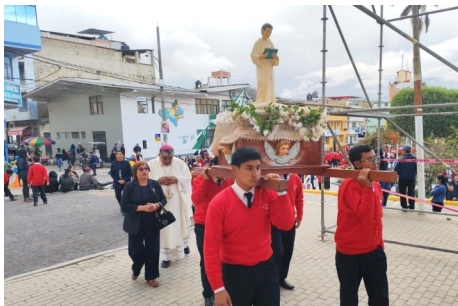
L'évêque préside l'Eucharistie pour la Saint Viateur