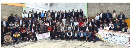
Assemblée pastorale de la prélatrice de Chota

Les 14 et 15 novembre s'est tenue l'Assemblée pastorale de la prélatrice de Chota. Outre toutes les congrégations religieuses présentes dans la prélatrice, des représentants d'organisations et de mouvements pastoraux et ecclésiaux étaient également présents. L'objectif, selon les mots de l'évêque, Mgr Víctor Emiliano Villegas, est de « continuer à construire l'Église sur la voie synodale ».