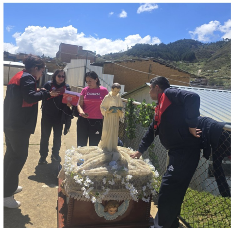
Célébration présidée par l'évêque du diocèse