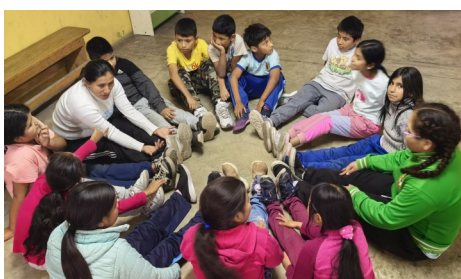
Activités de fin d'année à San Viator Collique

À la fin de l'année scolaire, 40 enfants de l'école publique Virgen de Guadalupe ont été accompagnés afin de renforcer leurs capacités en mathématiques et en communication. De même, 75 adolescents d'une autre école publique, José Gálvez, ont été accompagnés dans le domaine du tutorat afin de renforcer leurs capacités citoyennes et leurs connaissances en matière de droits humains. Dans l'atelier de pâtisserie, 50 femmes ont été formées à la fabrication de « panettones viatoriens », à l'approche des fêtes de Noël.